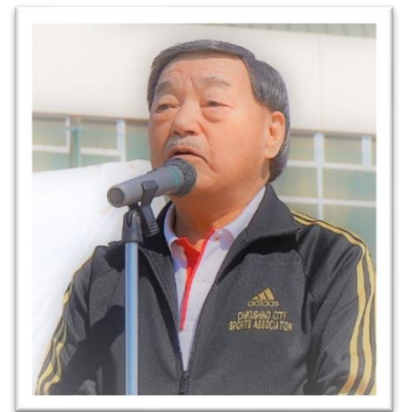
【主催者(藤木会長)の挨拶】

新型コロナウイルス感染予防により4年ぶりの開会となり、前会長の思いと併せて本協会が目指している「市民スポーツの振興」を行なうことができましたし、また今後は「スポーツを通じた青少年の健全育成」にも取り組んでまいりますので、どうぞ皆さま方のご理解とご協力をよろしくお願い致します。