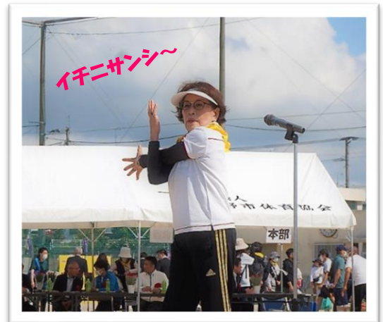
跡部副会長の準備運動